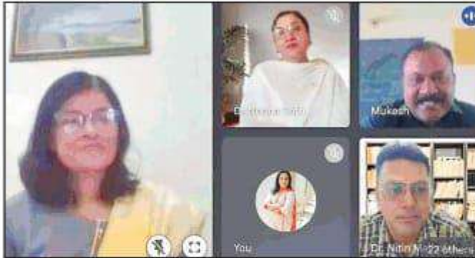
ਵੈਬੀਨਾਰ ਦਾ ਦ੍ਰਿਸ਼। (ਸੁਖਵਿੰਦਰ ਕੌਰ)

ਖੰਨਾ, 24 ਮਈ (ਸੁਖਵਿੰਦਰ ਕੌਰ) - ਗੋਬਿੰਦਗੜ੍ਹ ਪਬਲਿਕ ਕਾਲਜ, ਅਲੌੜ ਖੰਨਾ ਦੇ (ਆਈ.ਕਿਊ.ਏ.ਸੀ.) ਤੇ ਰਿਸਰਚ ਐਂਡ ਡਿਵੈਲਪਮੈਂਟ ਸੈੱਲ ਨੇ ਟ੍ਰਿਪਸ, ਡਬਲਿਊ. ਟੀ. ਓ. ਅਤੇ ਜੀ. ਆਈ. ਪ੍ਰੋਟੈਕਸ਼ਨ ਇਨ ਇੰਡੀਆ 'ਤੇ ਇਕ ਰਾਸ਼ਟਰੀ ਵੈਬੀਨਾਰ ਦਾ ਆਯੋਜਨ ਕੀਤਾ। ਕਾਲਜ ਦੀ ਪ੍ਰਿੰਸੀਪਲ ਡਾ.