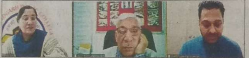
जी.पी.सी. में ‘बौद्धिक संपदा अधिकार’ पर हुए राष्ट्रीय वैबीनार का दृश्य। (सुरेश)

डा. तिवारी ने कहा कि हमें हर क्षेत्र में आविष्कारक के बौद्धिक संपदा अधिकार का