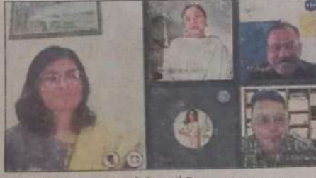
जी.पी.सी. द्वारा आयोजित वैबिनार का दृश्य।